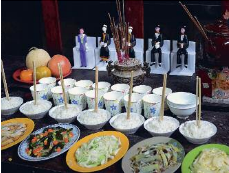
Ofringer af mad og drikkevarer til forfædrene i Donyuetemplet i Tainan, Taiwan. Bag anretningen ses forfædrefigurer fremstillet i papir. Den ofrede mad og drikke er nøjagtig som den, de levende spiser.

praksisser, der ikke kunne relateres til et af de tre læresystemer. Især den religiøse overbevisning om forfædrenes betydning og magt i forhold til familielivet og slægtens beståen har sin rod i en ældgammel kinesisk kultur, før der overhovedet eksisterede daoisme, kongfuzianisme og buddhisme. Mange religiøse skikke, ritualer og myter i kinesisk religion har derfor ikke ophav i de institutionaliserede religioner. Det gælder fx ofringer til forfædrene, udførelse af begravelser, shamanisme og konsultationer hos spådomsmagere. Et kendetegn for folkereligionen er indelingen i guder, ånder, spøgelses (dæmoner) og forfædre, der principielt ikke er væsensforskellige fra menneskene, men er underlagt de samme naturlige kræfter i universet. Et vigtigt skel er forskellen mellem de levende og de dødes verden, der sidestilles med henholdsvis yang- og yin-domænet – lyset og mørket. Alligevel oplever man, at der ikke er en absolut adskillelse mellem de to verdener, idet der er et nært kommunikativt forhold mellem dem.