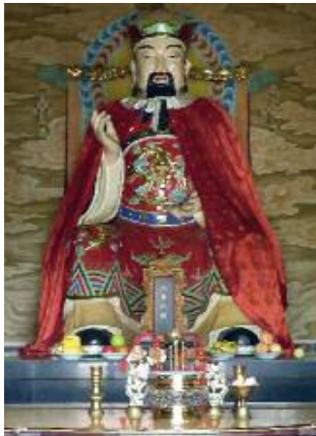
Guden for rigdom (caishen) i De Otte Udødeliges Tempel i Xi'an, Kina.

Ikke alle vigtige guder fremgår af et bureaukratisk gudesystem, fx kan man nævne guden Guanyu (også kaldet Guandi) og Guden for Rigdom ( Caishen ). Som guder, der bor i himlen ved Jadekejserens hof, opfattes de i reglen som uafhængige guder. Guanyu, der oprindeligt var en general fra Handynastiet, ses i den kinesiske verden som beskytter mod onde ånder og som garant for