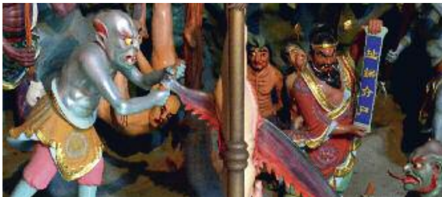
Scene fra Daxingshan-templet i Xi'an, som viser afstraffelse i helvede.

embedsmænd. Hvis man gik ad sølvbroen, betød det, at sjælen ville blive genfødt som en gud. De fleste sjæle måtte dog gennemgå mere eller mindre afstraffelse i helvede. De begravelser- og sørgeritualer, som eksisterer blandt den kinesiske befolkning, har det primære formål at få sjælen gennem døms- og strafprocessen i helvede så hurtigt som muligt.