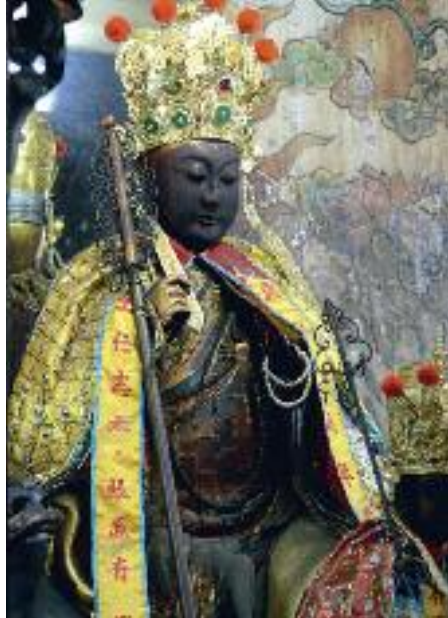
Bodhisattvaen Dizang, som kan frelse mennesker fra det dybeste helvede. Han bærer en stav, som kan oplukke helvedes porte.

Oprindeligt havde kineserne ikke nogen tanke om et helvede med afstraffelse af sjælene, men var mere kollektivt orienterede i spørgsmålet om efterlivet. Derfor var det vigtigste, at de så sig selv, både i livet og døden, som en del af den biologiske slægts kontinuitet. Senere blev efterlivsforestillingerne influeret af buddhismen og karma-tanken. Ikke alle sjæle i helvede led en grum skæbne. De, der havde levet et eksemplarisk liv, kunne umiddelbart løslades og forlade underverdenens rige ad én af to broer. De to broer kaldes ofte for guldbroen og sølvbroen, og sjælen havde mulighed for at beslutte, ad hvilken bro den skulle træde ind i efterlivet. Guldbroen ledte til et liv i Paradis, også kaldet Vestens Rene Land ( xifang jingtu ). I dette paradys hersker buddhaen Amitabha, og herfra er der mulighed for at opnå det, som den institutionaliserede buddhisme kalder nirvana ; altså en udtrædelse af fødsels- og døds-cykklussen. Sølvbroen leder sjælen til Himlen, til Jadekejsersens rige, der var befolket med guder og himmelske