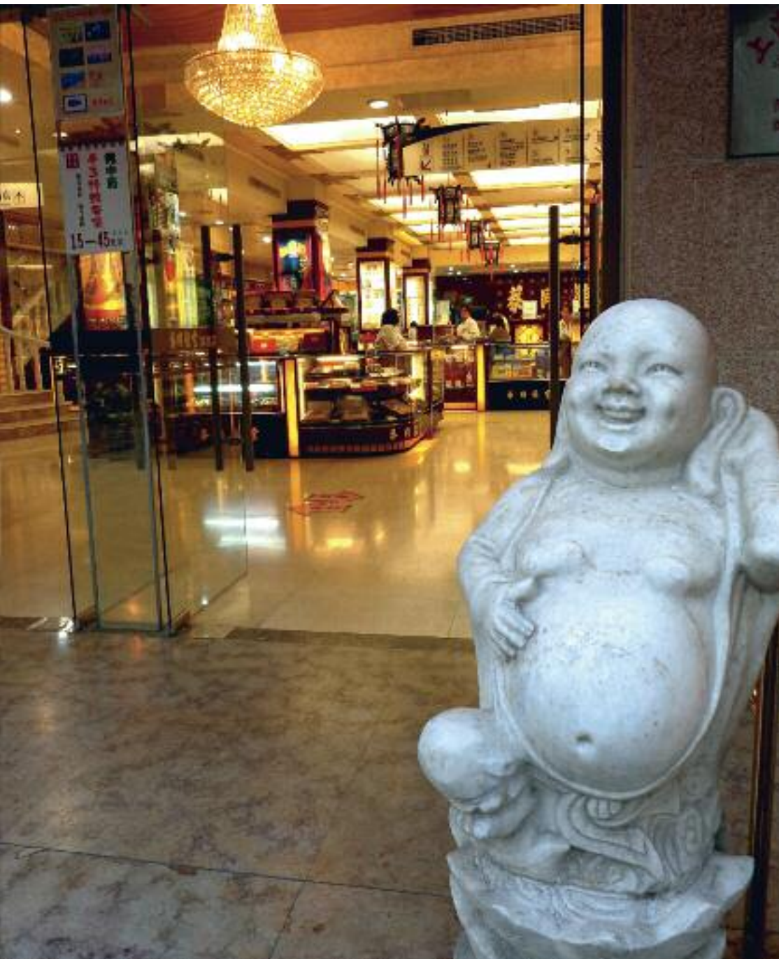
Den "fede Buddha" Budai er symbol på velstand og lykke, også her i Shanghai.